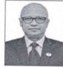
মেঃ মুজাম্ম হোসেন পরিচ আসিসি ও পবিত সম্পদ বিজ্ঞান